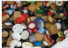
プラスチック製キャップ (PP)