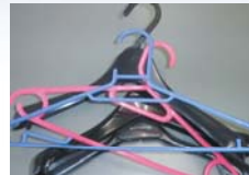
プラスチック製ハンガー (PP)