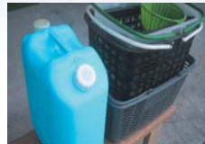
灯油缶・ランドリーバスケット (PP)