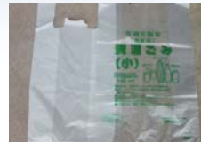
レジ袋・ゴミ指定袋 (PE)